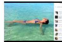
Miranda Kerr zeigt auf Instagram sexy